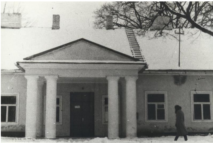
Šiame pastate biblioteka veikė 1980-1997 m. ir nuo 2003 m. iki šių dienų.

byrėti tinkas, 1980 metais, pasirūpinus rajono valdžiai, biblioteka perkelta į dvarą – buvusias vaikų darželio patalpas.