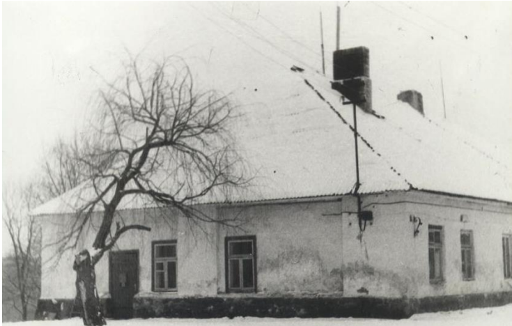
Šiame pastate biblioteka veikė nuo 1977 m. iki 1980 m.

1977 m. melioratorių vadovybė, matydama, kad patalpos ankštos, kad reikia skaityklos patalpų laikraščių ir žurnalų skaitymui, bibliotekai skyrė naujas patalpas (buvusi dvaro oficina, dabar – privatus namas). Jai buvo paskirti 2 kambariai. Tačiau sąlygos ir čia nebuvo geros, patalpos drėgnos, trūko baldų. Jais buvo apstatytas tik vienas kambarys, kitame buvo tik skaityklos kėdės. Patalpos kūrenamos malkomis, teko pačiai bibliotekininkei kūrenti krosnis, dideli kambariai buvo pakankamai vėsūs.