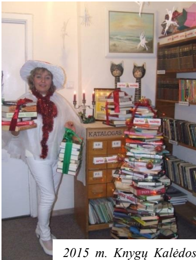
2015 m. Knygų Kalėdos.

Bibliotekoje lankytojų visada pilna, tai vieta kur „verda“ gyvenimas. Čia renkasi visi, kurie nori bendrauti, pavartyti spaudą, paskaityti, pasėdėti ir patylėti, „išsikrauti“, prisėsti prie kompiuterio, pasidalinti savo mintimis, receptais ir daug dar kuo.