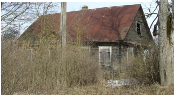
Senoji Jasiuliškių biblioteka.

Biblioteka pensionate buvo įkurta apie 1960 metus, buvusio dvarininko V. Stomos pastate. Iš pradžių knygų bibliotekoje palikdavo pensionato globotiniai, fondo komplektavimas nebuvo reguliarus. Bibliotekoj dirbo pensionato darbuotoja seselė B. Lemešovienė.