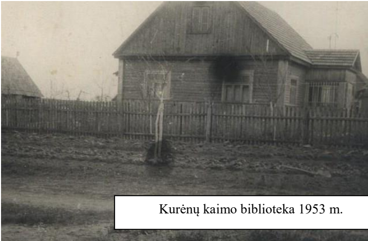
Kurėnų kaimo biblioteka 1953 m.