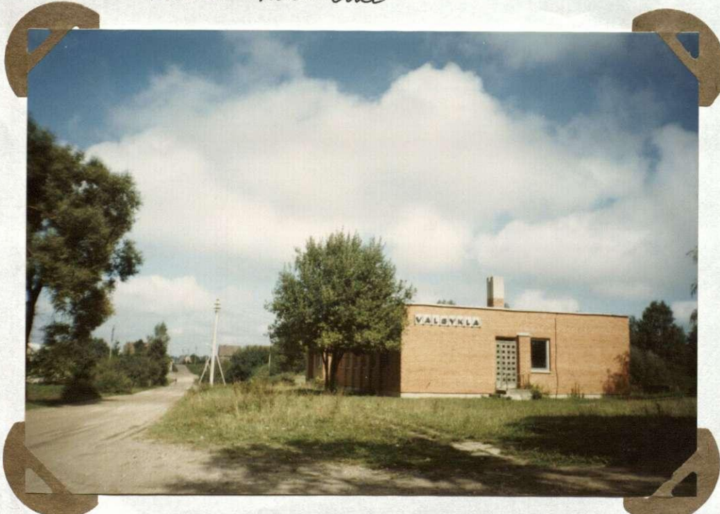
Nr. 6 Vālgykla postatyta 1984 m. Stolōwka zbudowana w 1984 r.