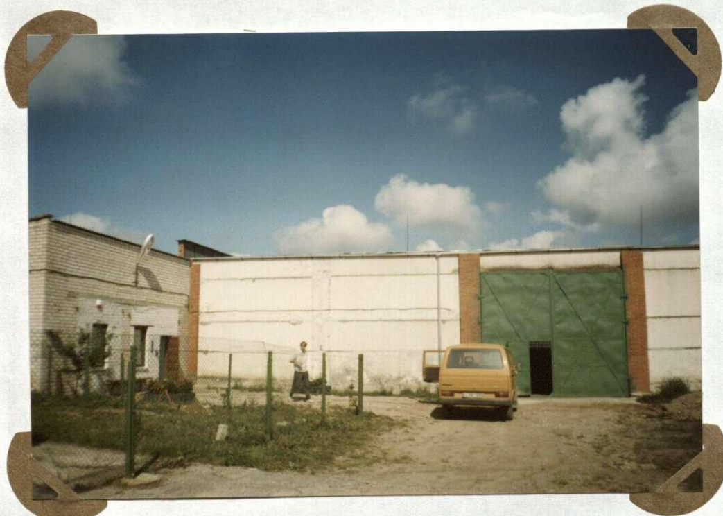
№. 10 UHB „Akwasanas“ Spółka akcyjna „Akwasanas“