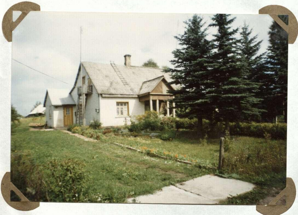
Nr. 5 Nāmas, kuziame ģisikūzē pirma kolūķio valdyba Dom, w którym mieściła się pierwsza rada kolchozu