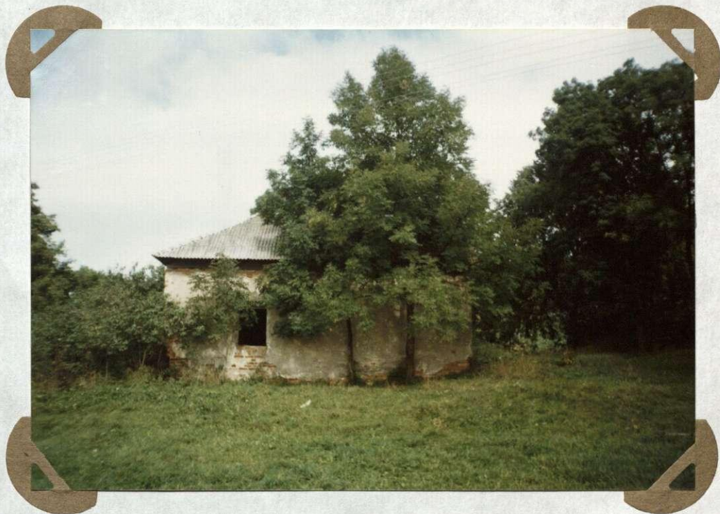
№. 19 Kopyčia , pastatytā XVII am.