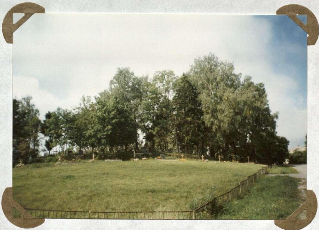
№. 24 Eitminiškių kapinės Cmentarz w Eitminiszkach