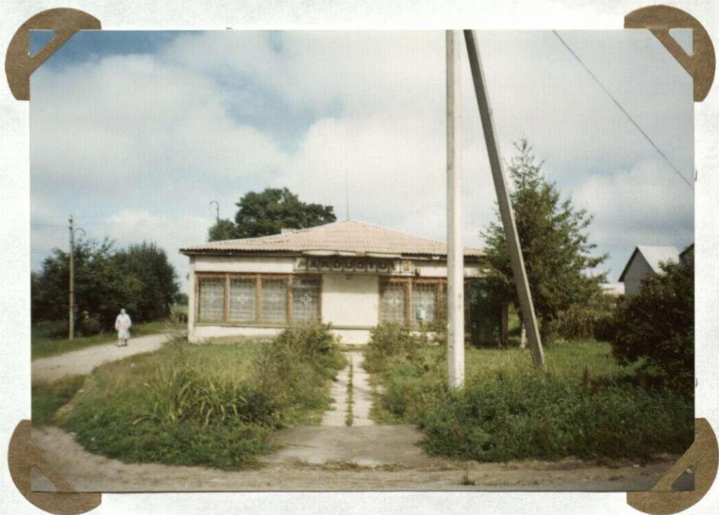
№. 3, 4 Eitminiškių paštas iz parduotuvė Ejtminiska pošta i sklep