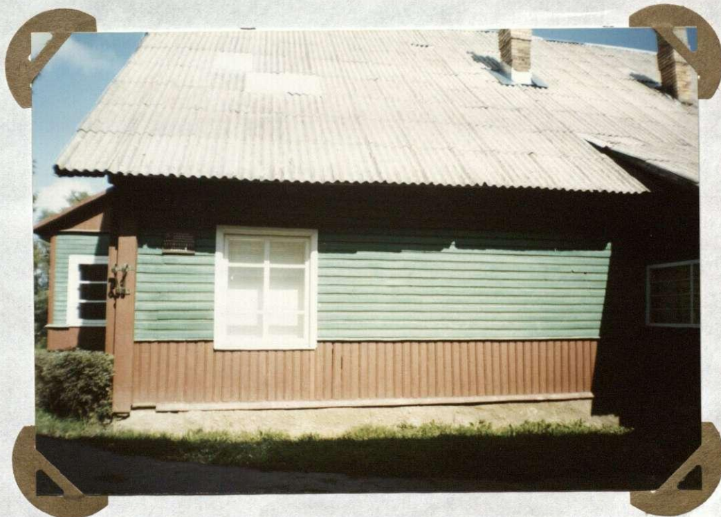
№. 16 Pastatas, kuriame įsikūzė lietuvių mokykla Budynek, w którym założona litewska szkółka