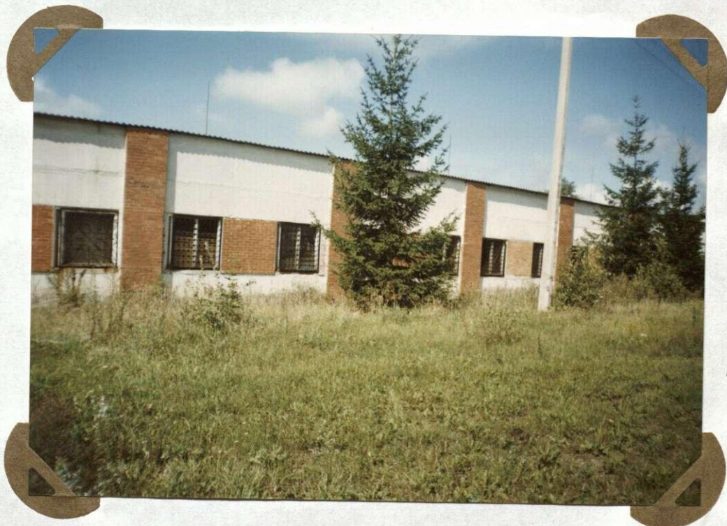
№. 8 UAB „Eitminiškės“ Spółka akcyjna „Ejtminiszkiės“