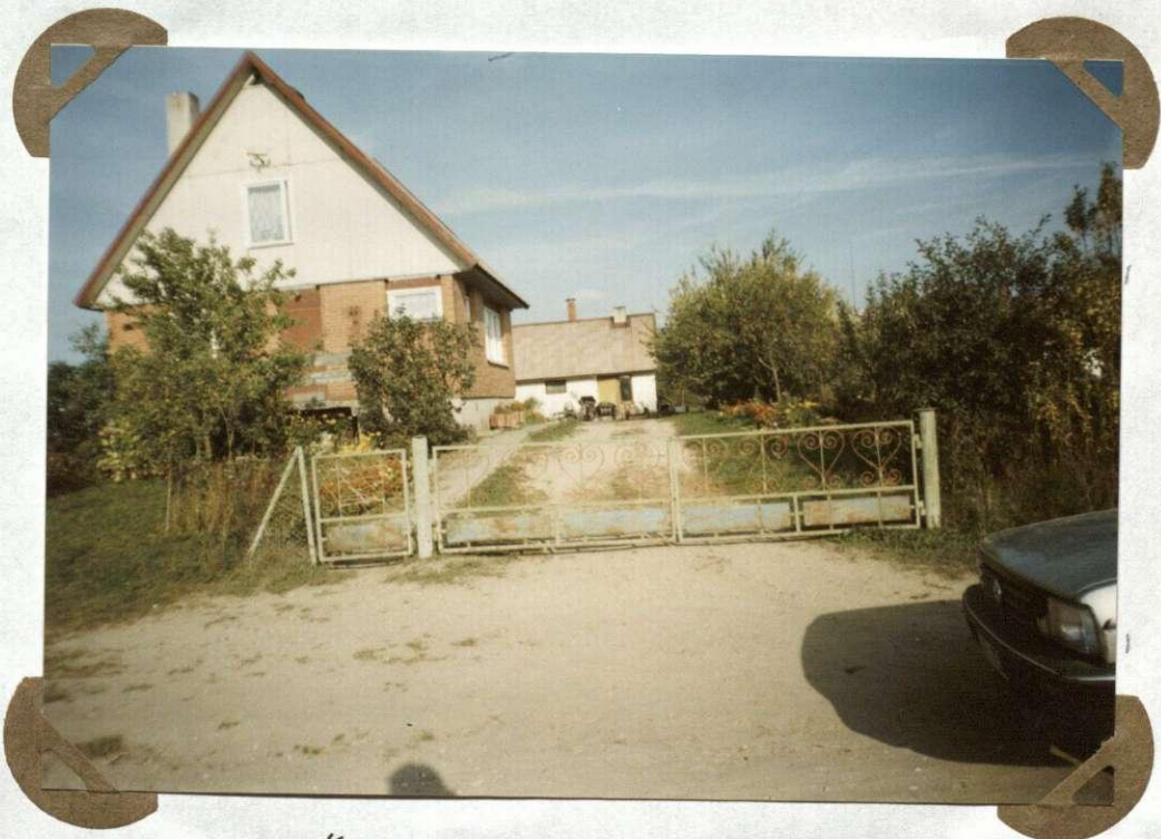
№2. 12 Šiuolaikinių Eitminiškių gyv. namas Dom nowoczesnych Eйтминисzek