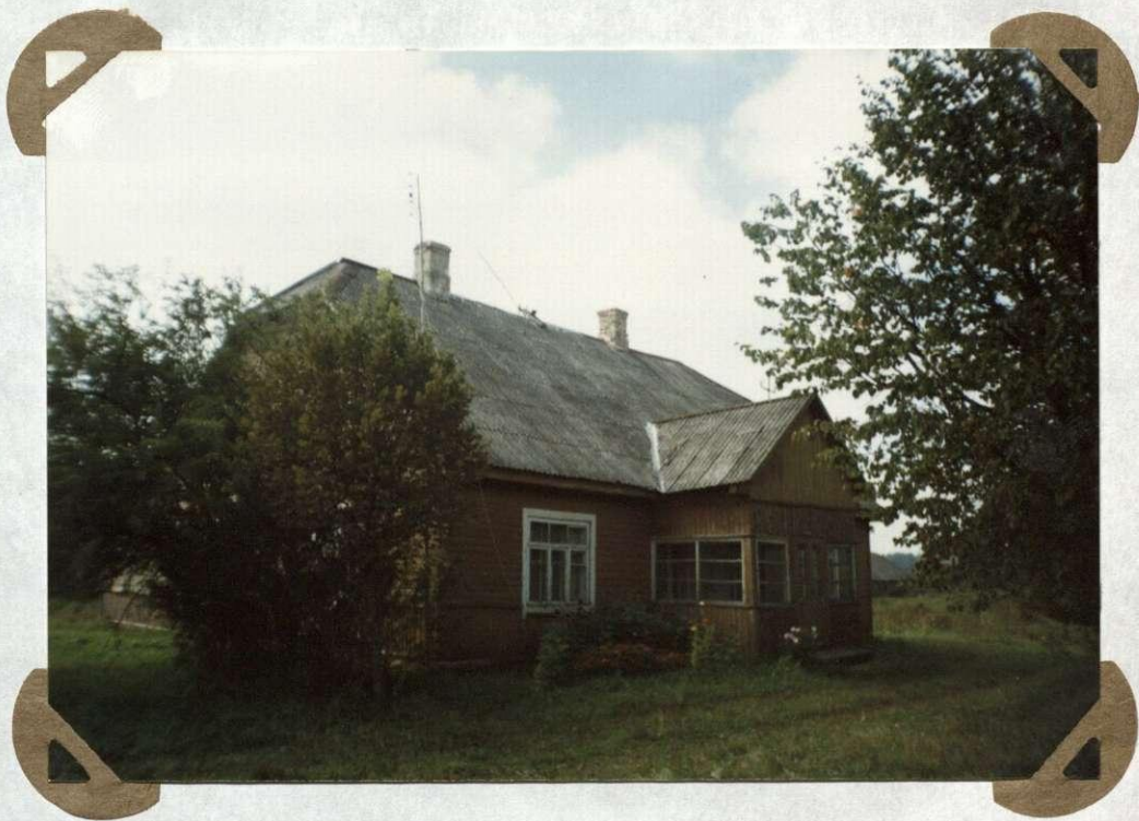
№. 15 Internatas