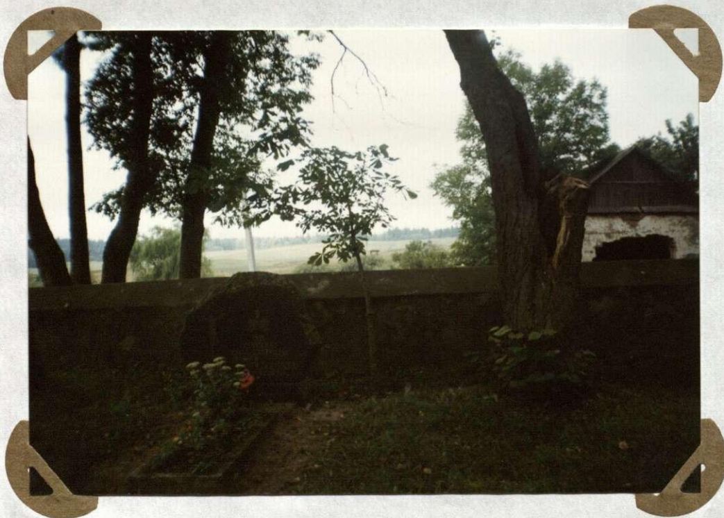
№. 22 Kunigo Sylwestro Malachovskio antkapis kapinės Madgrobek księdza Sylwestra Malachow- skiego