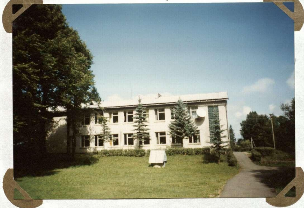
№. 14 Plytinė mokykla pastatyta 1970 m. Ceglama szkoła zbudowana w 1970 r.

Dom F. Czerniawskiego, w którym była założona pierwsza szkoła w Ełminiszkach