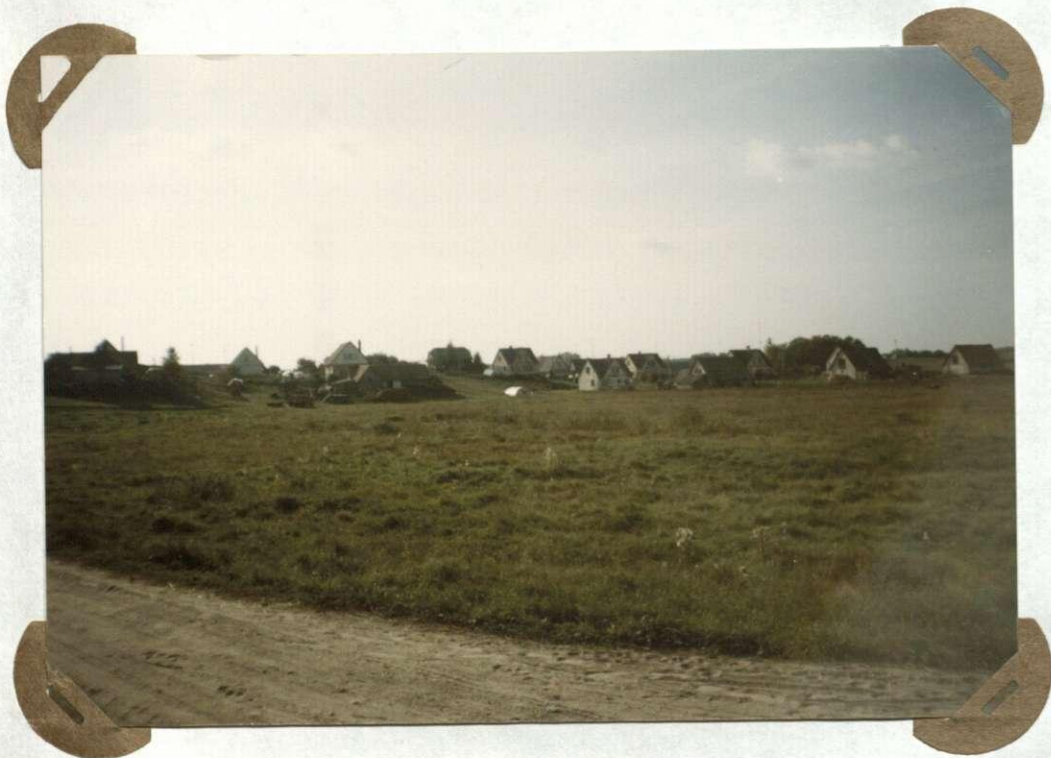
№ 1 Eitminiškių kaimo vaizdas Widok wsi Eitminiszki