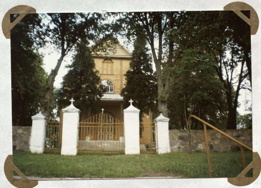
№. 20 Šr. Antano Paduviečio bažnyčia Kościół Śr. Antoniego Paduwskiego