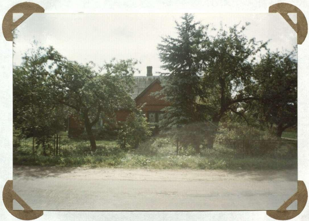
№2. 11 Senų Eitminiškių medinis gyvenamas namas Drevniansy Древнианы дом даwnых Eйтминисzek