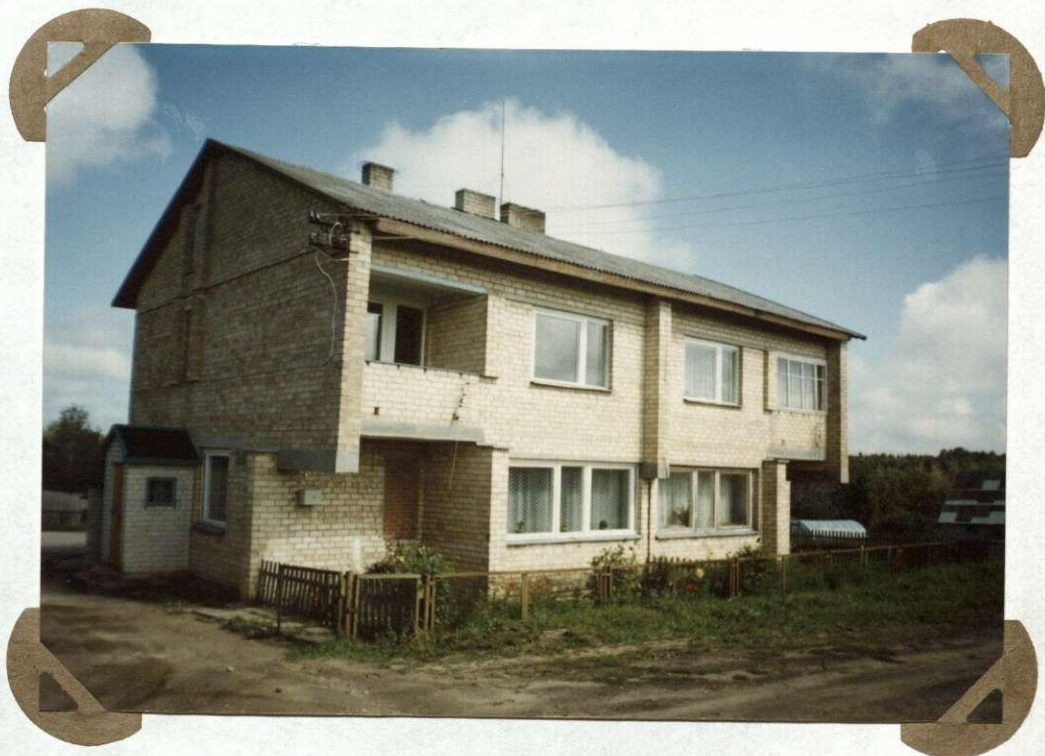
№. 7 Vaikų darželis pastatytas 1985 m. Przedzkole zbudowane w 1985 r.