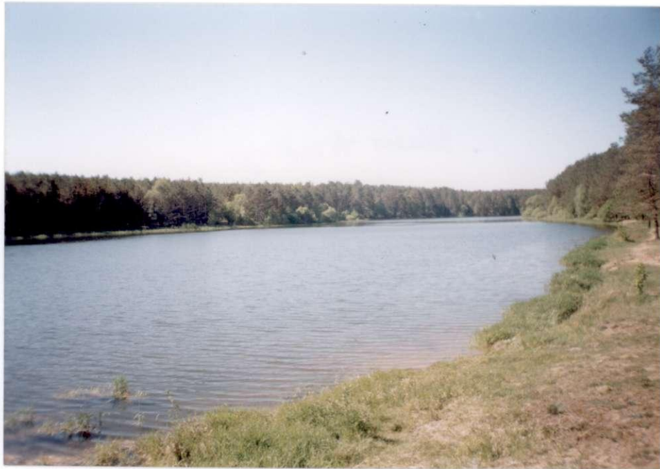
Gelužos tvenkinys. 2000 m.

1968-1971 m. per Gelužos upelį buvo supiltas pylimas, pastatyta užtvanka. Susikaupęs vanduo sudaro nemažą tvenkinį, kuris puošia Tiltų kaimo aplinką. Prie tvenkinio galima poilsiauti, maudytis, žvejoti. Jo krantus iš abiejų pusių supa pušų miškai. Tvenkinio gale tebeperi laukinės antys ir gulbės. Neretai pamatysi kaip paskui gražuolę gulbę plaukia pulkelis mažų gulbiukų. Nors ties kaimu Geluža teka siaura vagele, tačiau ir čia nardo ondatros, o prie Salos miško bebrai stato užtvankas, antys peri ančiukus. Žiemą, kai kitur vandens telkiniai užšąla, čia jų suskrenda pulkai.