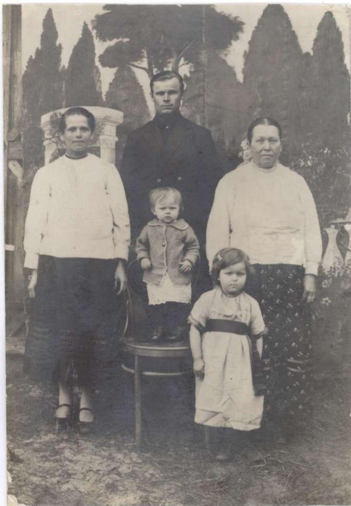
Šeimos išeginiai drabužiai. 1930 m.