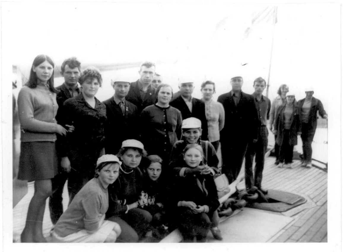
Kolūkiečių ekskursija į Leningradą. 1969 m.

Kolūkio darbuotojams buvo organizuojamos ekskursijos po Lietuvą, į Maskvą, Leningradą, Užkarpatę, Brestą, aplankyta Sočis, Jalta, Armėnija, Abchazija. Kelionių išlaidas apmokėdavo kolūkis. Kolūkiečiai pasižvalgydavo po plačiąją tuometinę Sovietų Sąjungą, praplėsdavo akiratį, susipažindavo su kitų tautų kultūra, architektūra, istorija.