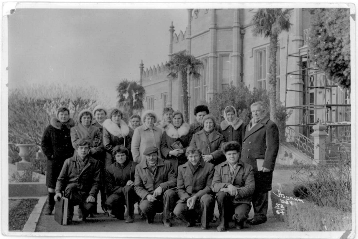
Kolūkiečių ekskursija į Krymą. 1984 m.