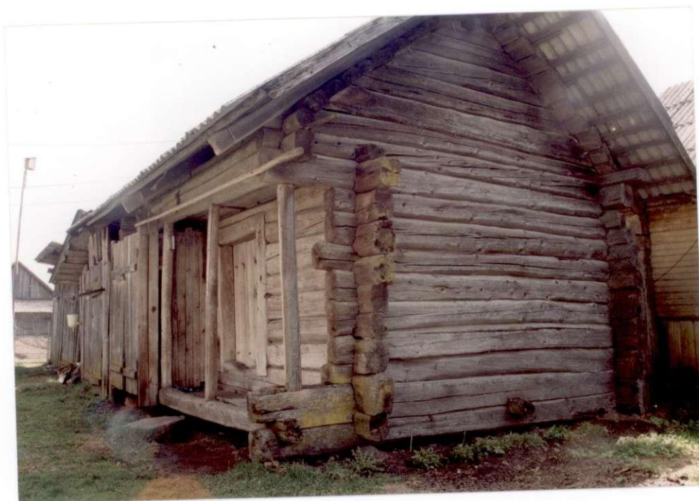
Juozo Kaziukonio sodybos svirnas. 2000 m.