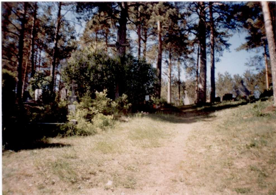
Kaimo kapinės. 2000m.

Šiaurinėje kaimo pusėje ant kalnelio yra kaimo kapinės. Anksčiau buvo mažesnės, aptvertos medine tvora, apaugusios alyvų krūmais, nelabai prižiūretos. Vėliau praplėstos, aptvertos vieline tvora, alyvos iškirstos, paliktos senos pušys. Iš senovinių paminklų liko tik vienas medinis kryžius ir keletas akmenų paminklų. Yra anksčiau statytų cementinių, paskutinais dešimtmečiais – daug šlifoto akmenų paminklų. Čia palaidoti „Geležinio vilko“ rinktinės partizanai, žuvę 1945 m. Pagelučio kaime.