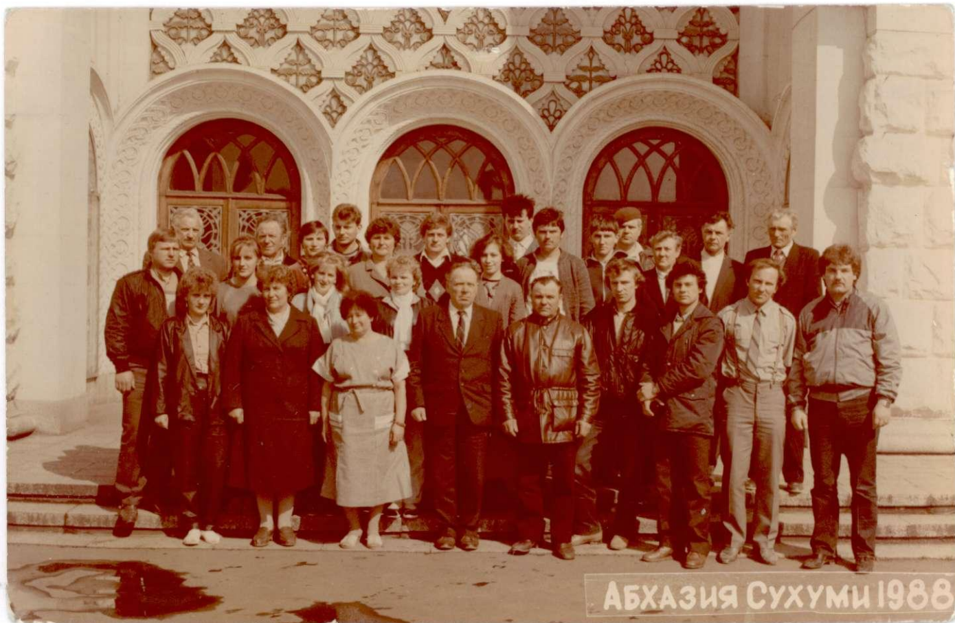
Grupė kolūkiečių ekskursijoje Abchazijoje. 1988 m.

1990 m. kolūkyje buvo 334 nariai: iš jų 164 darbingi kolūkiečiai (104 vyrai ir 60 moterų) ir 170 pensinio amžiaus.