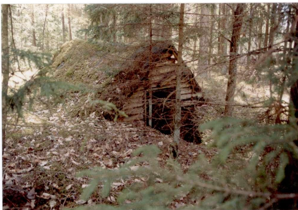
Partizanų žeminės Inklėriškėse

Palaiapsniui kilo priešinimasis vokiečių okupacijai. 1943 m. Rūdininkų girioje Inklėriškių miškuose kūrėsi raudonųjų partizanų būriai. Tokio pasipriešinimo metu Tiltų kaimo gyventojai naktimis buvo varomi pjauti telefono-telegrafo stulpų prie geležinkelio. Surinkdavo po 20 vyrų. Kiekvienai porai reikėdavo nupjauti po 5 stulpus. Kai vokiečių sargybinis pasitraukdavo į budėjimo pastatą, vyrai imdavosi darbo. Patys partizanai su šautuvais gulėdavo miške ir stebėdavo, ar neatrieda traukinys. Išgirdę atvykstantį, vyrai traukdavosi į mišką, nes vokiečiai, pamatę užverstus bėgius, išlipę šaudydavo į visas puses.