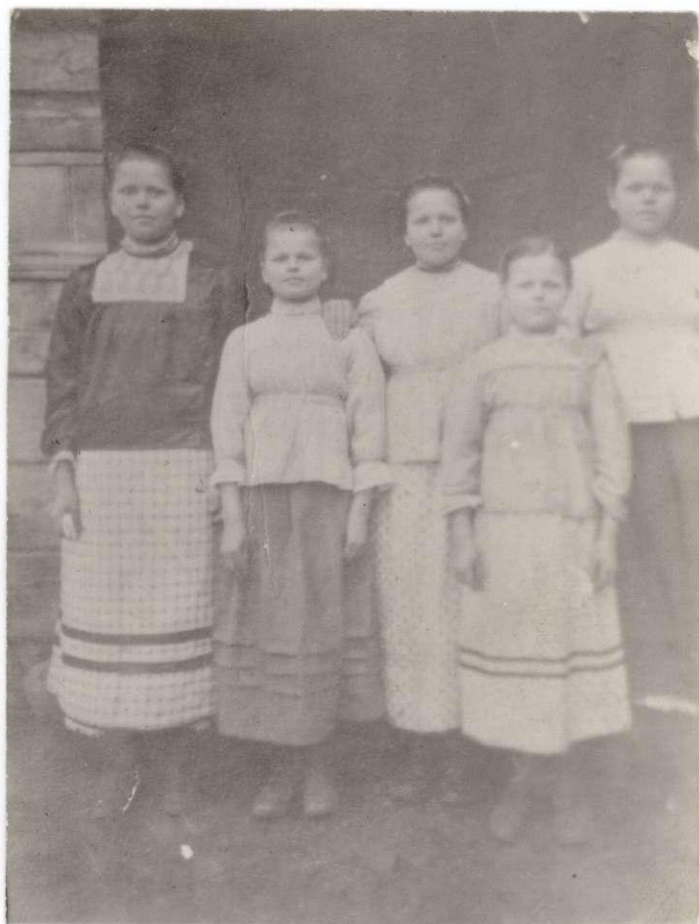
Jaunų merginų drabužiai. 1924 m.