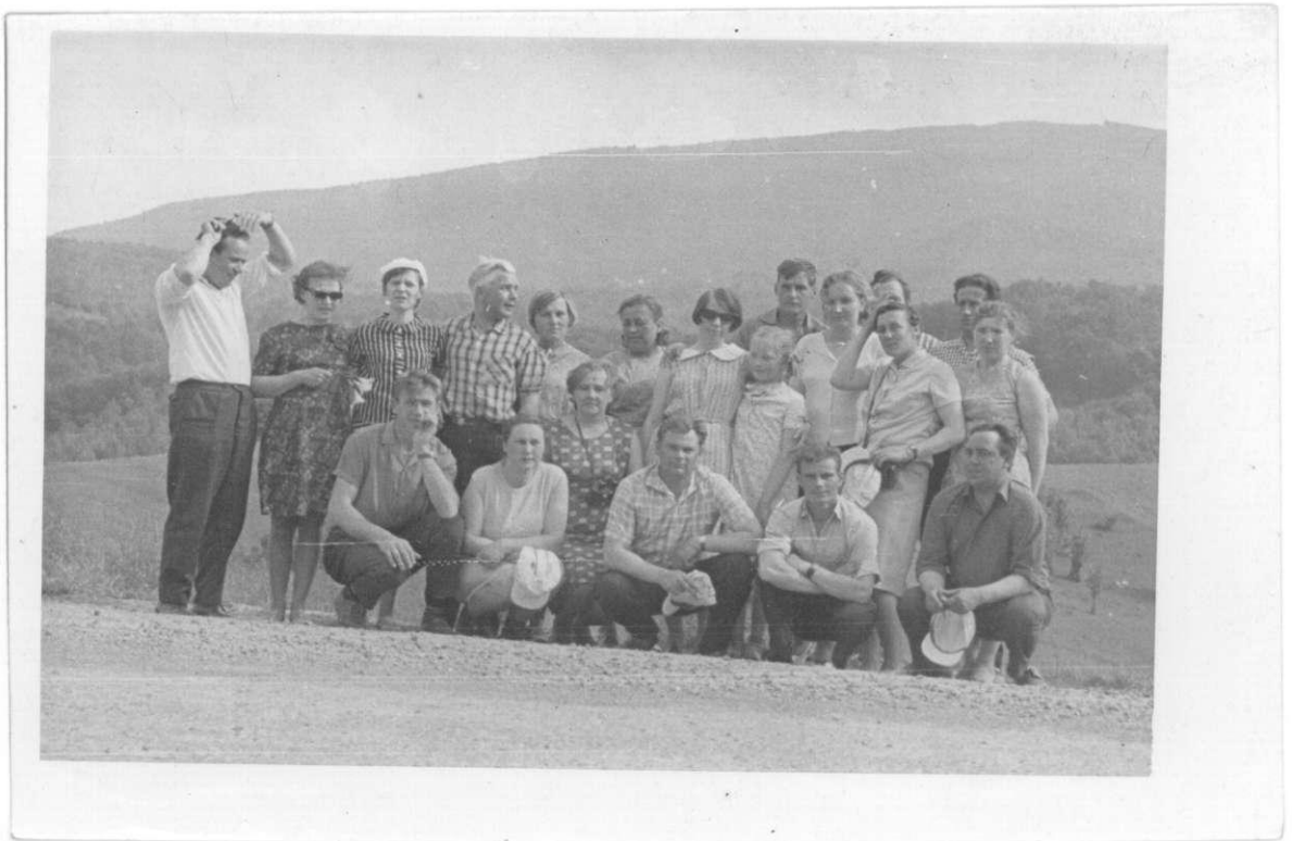
Kolūkiečiai Užkarpatėje. 1970 m.