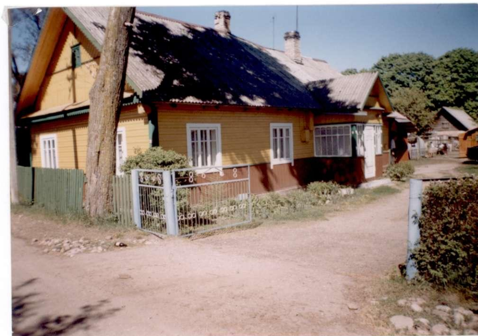
Stasio Staknio namas. 2000 m.