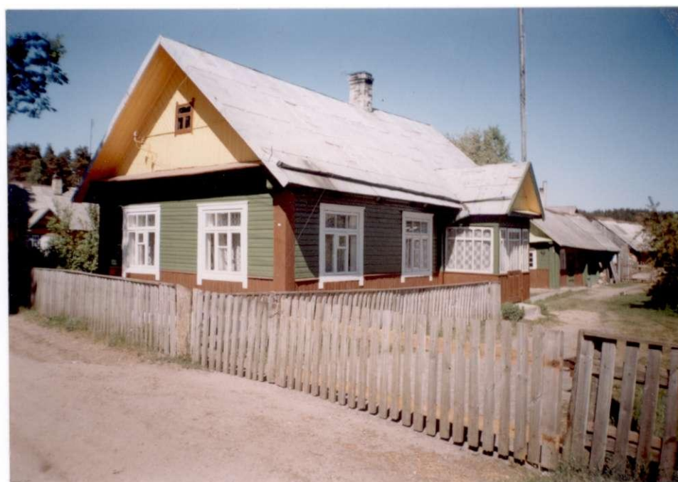
Juozo Uždavinio namas. 2000 m.