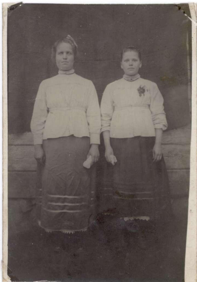
Jaunų merginų drabužiai. 1924 m.