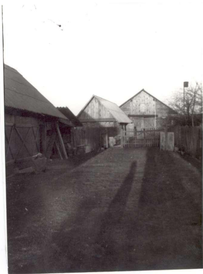
Stanislovo Lebednyko kiemas ir ūkiniai pastatai. 1983 m.