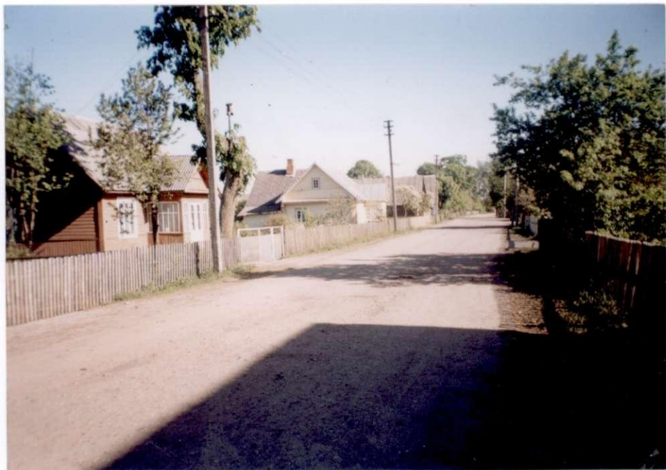
Kaimo gatvė. 2000 m.