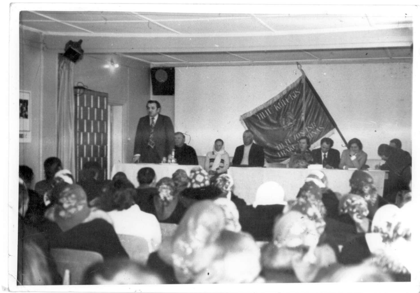
Tiltų kolūkiečių ataskaitinis susirinkimas. 1978 m.

Nuo 1968 m. buvo atsisakyta darbadienių, kolūkiečiams pradėtos mokėti 12 rublių pensijos, kurios vėliau po truputį kilo: 15,20,40 rublių. Jau 1970 m. kolūkis turėjo milijonines pajamas ir buvo vadinamas „milijonieriumi“. Pasiekęs gerų gamybinių rezultatų, gaudavo daug pelno, didėjo kolūkiečių atlyginimai. 1980 m. kolūkio sąskaitoje buvo 1 mln. 600 tūkst. rublių.