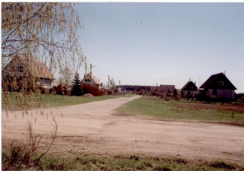
Alytaus statybos kombinato surenkamųjų gyvenamųjų namų kvartalas

1978 m. pastatytas kompleksinis parduotuvės ir valgyklos pastatas. 1980 m. pastatyti pirmieji šeši Alytaus statybos kombinato surenkamieji skydiniai namai, 1985 m. – dar 10 tokio tipo gyvenamųjų namų, 1991 m. – penki (kartu su dviem plytų namais) išsidėstyti žiedu. Visi statyti kolūkio lėšomis, o atgavus Lietuvai nepriklausomybę privatizuoti už investicinius čekius.